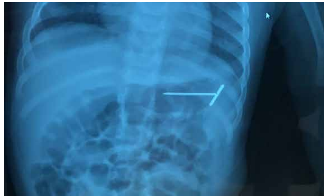
בתמונה (צילום הרנטגן של הסיכה בקיבת התינוק)

זהו אחד החששות שכל הורה לילדים צעירים חי עמו - חוסר תשומת לב רגעית ותינוק שבולע עצם זר. כאשר מדובר בפריטים זעירים והפעוט אינו מראה סימני חנק יש להמתין מספר ימים בתקווה שאותו פריט (לגו לדוגמה) יצא בצורה טבעית. אך מה קורה כאשר התינוק בולע חפץ מסוכן כמו סיכה?