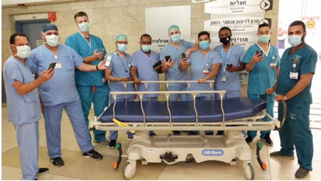
בתמונה: השליחים של שערי צדק מוכנים לפעולה.

המערכת מאפשרת תנועה מבוקרת של מטופלים בשטח המרכז הרפואי באופן היעיל, הבטוח והמהיר ביותר. כל זאת על מנת לאפשר למרכז הרפואי למלא את ייעודו במתן שירותי רפואה ברמה הגבוהה ביותר. הודות למערכת החדשה, ניהול השליחים שמניידים מטופלים בין המחלקות מתבצע באמצעות אפליקציה מיוחדת שמחוברת למערכת הניהול של המרכז הרפואי.