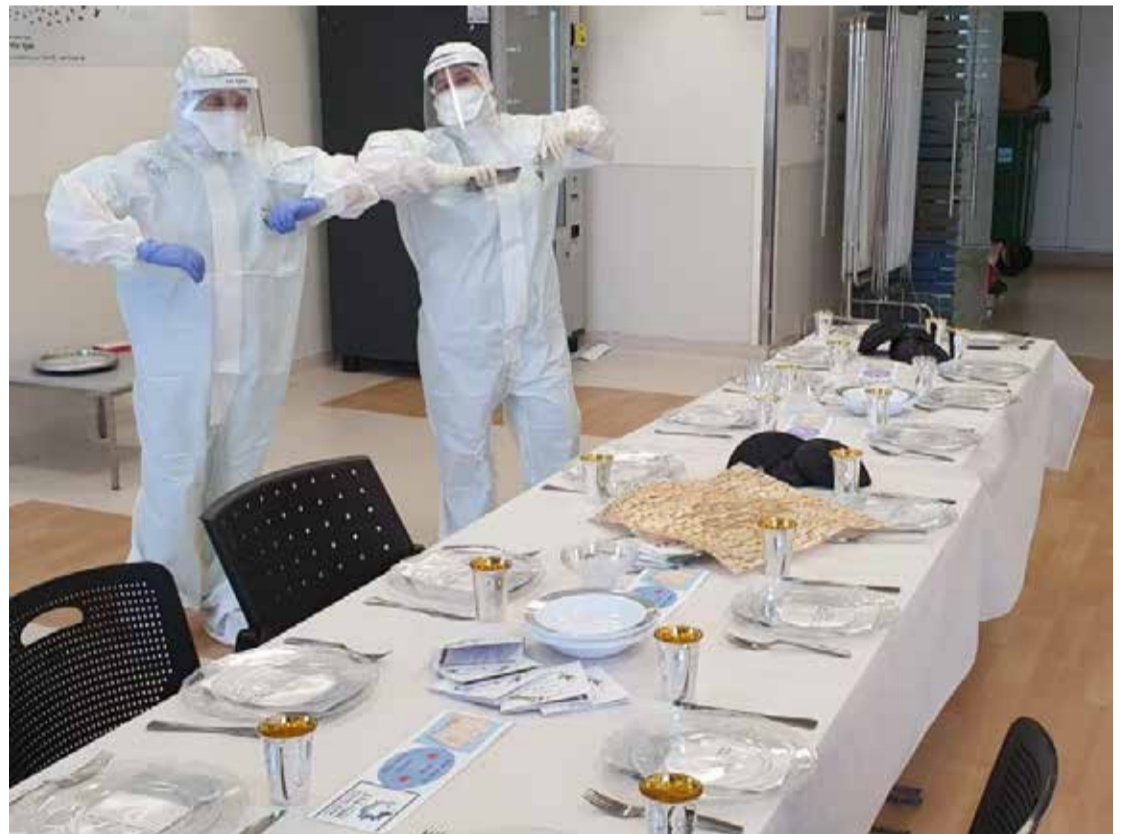
בתמונה: שולחן ליל הסדר במחלקת כתר.

אז איתרנו עוזר רופא שנכנס בתפקיד ממוגן לתוך המחלקה והניח תפילין לחולה. דאגנו בסופי שבוע למסור עבור החולים ציוד של שבת ודת, פריטי קידוש והבדלה, נרות לשבת, סידורי תפילה ותהילים. עברו ימים ורבים מהמטופלים קבלו שלילי בבדיקה והחלימו. מהם שיצאו לביתם או למלונות שהוקמו וכאלה שעברו למחלקות אשפוז רגילות בביה"ח לשם טיפול בבעיות רפואיות שונות. אלה שנשארו נאלצו להשאיר במחלקה המבודדת חבילה ובה הציוד האישי שלהם שכלל לעיתים גם תפילין, את הציוד יכלו לקבל בחזרה רק כעבור שבוע ימים. אחד מהמטופלים הללו היה מוטרד מכך שאין ברשותו את התפילין שלו ומצאנו פתרון בתיאום עם המחלקה למניעת זיהומים בבית החולים, לפירוק רצועות התפילין כך שיוכל לקבל את בתי התפילין לאחר חיטוי עם אספקת רצועות חדשות.