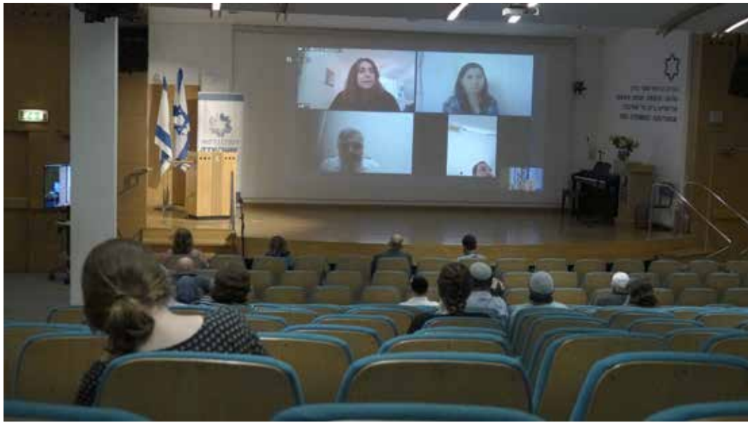
בתמונה: הרצאה בזום בתוך סדנת הפרידה.