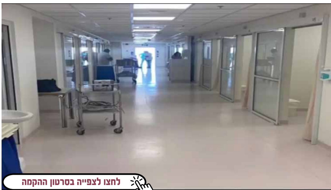
ליחצו לצפייה בסרטון ההקמה

בשעה טובה הושלמה בניית התשתית להרחבת חדר המימון במרכז הרפואי שערי צדק. במבנה החדש מתחם חירום נפרד וחיצוני עם הגנה מקסימלית במקרים של אירועים ביולוגיים. השלב הראשון שהוקם משמש כמחלקה מבודדת לחולי קורונה ובעתיד יהווה חלק מרכזי מחדר המימון החדש ומתפסת ההפעלה החדשנית במימון המהיר והחדש. המתחם נבנה לפי דרישות משרד הבריאות וכולל 15 חדרים נפרדים לטיפול בטוח, מערכות מיזוג משוכללות הכוללות הפרדת לחצים ופילטר מיוחד לניקוי האוויר ומניעת התפשטות זיהומים, אזור הנפשה לרווחת המטופלים ומטבחון ומתחם כניסה נפרד וחיצוני כדי למנוע כניסה משטח בית החולים למחלקה. מטופלי המתחם מנוטרים הודות למרכז שליטה לצוותים שנבנה למטרה זו ומצלמה אישית ומיקרופון של כל חולה למרכז השליטה, זאת על מנת לאפשר תקשורת מלאה בין הצוותים המטופלים למטופלים.