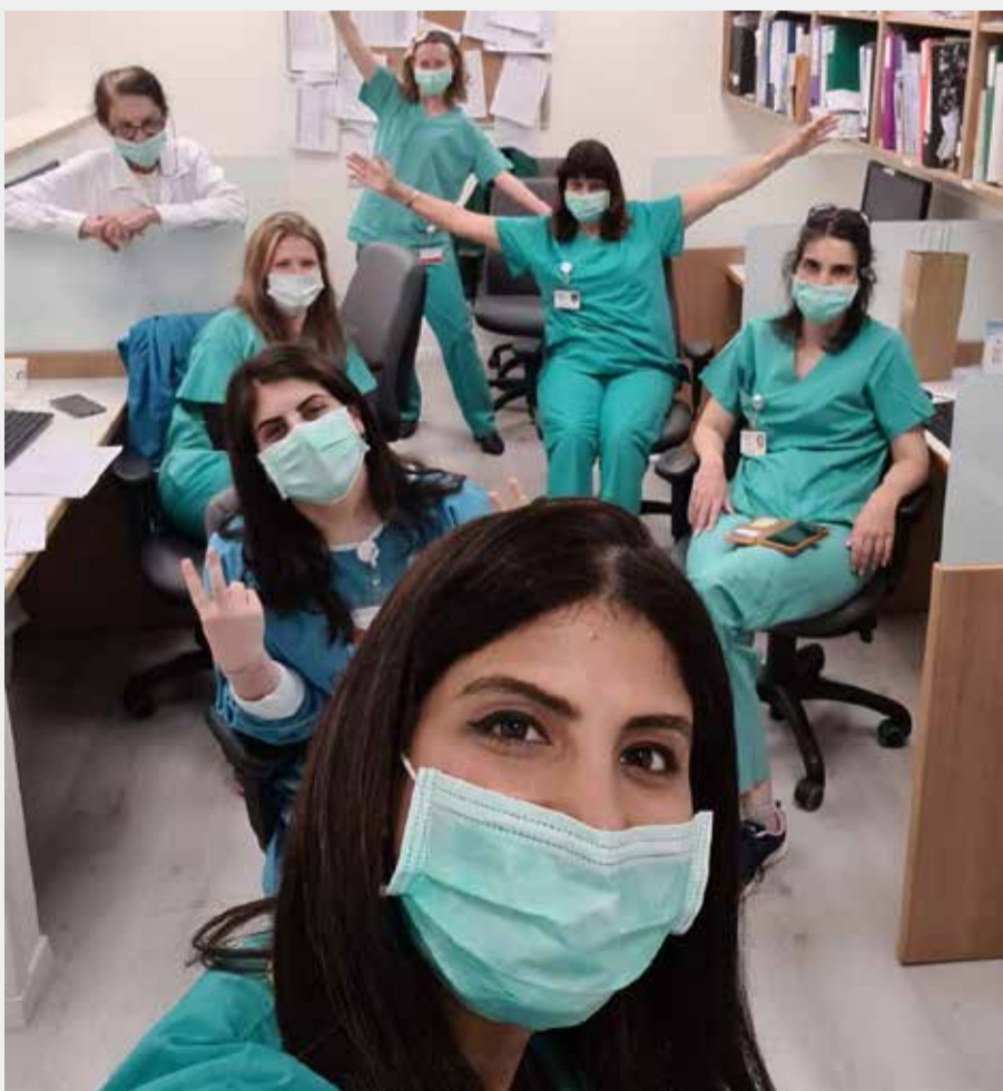
בתמונה: צוות הדיאטניות של המרכז הרפואי שערי צדק.

צוות המחלקה לתזונה ודיאטה במרכז הרפואי שערי צדק בסיכום נקודות ציון משמעותיות שאילצו אותן להתאים את שיטת העבודה למצב החדש